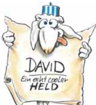
Anmeldung Kindermusical 2023

JUZ und im kommenden Herbst auch nicht. Deshalb wollen wir nach langer Pause dieses Jahr wieder mal ein Kindermusical machen. Und zwar eins über eine Figur aus der Bibel. Und das