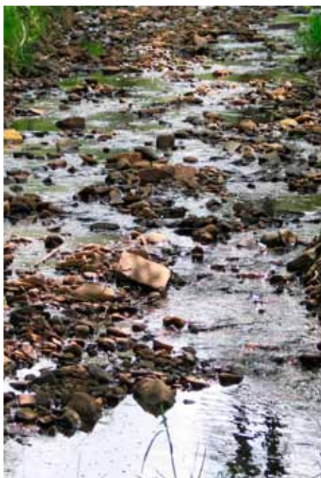
Hemelbach im Reinhardswald

Zwei Berichte, in denen es besonders um die Vertrauens- und Glaubensfrage geht, haben mich schon immer angesprochen: Jesus kommt zu seinen durch den Sturm verängstigten Jüngern über das Wasser und stillt die Stürme. Wird da doch die Verbindung zur Schöpfungsgeschichte aufgezeigt, als „der Geist Gottes über dem Wasser schwebte.“