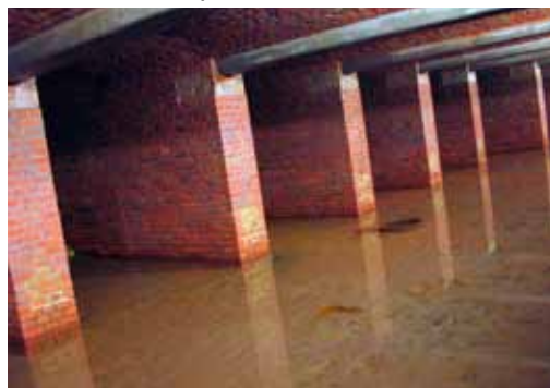
Quellstollen oberes Lempetal

Das hört sich gut an, wie viel Wasser kommt denn aus den Quellen und wie ist die Wasserqualität?