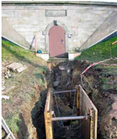
Rohrbruch im Rohrgraben beim Hochbehälter Schöneberg.

Inzwischen wurde die Quelle wegen des durch starke Düngung zu hohen Nitratgehalts vom Netz genommen. Im Notfall wäre sie aber kurzfristig einsatzbereit, zumal der Nitratgehalt inzwischen gesunken ist.